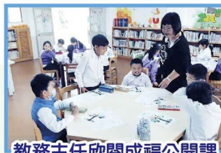
教務主任欣閱成福公開課