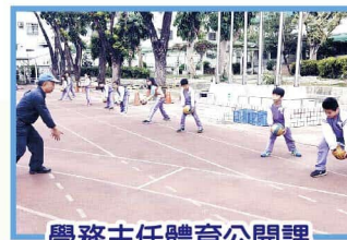
學務主任體育公開課