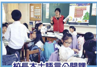
校長本土語言公開課

感謝為潭陽學子努力付出精進的教師們，課前的會談說課、觀課時的詳實記錄、觀課後回饋省思，相信對教學者暨觀課者皆受益良多，彼此教學相長增能，最大受益者是我們潭陽的學子們，師生們一起自發、互動、共好喔！