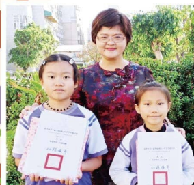
閩南語講古第二名