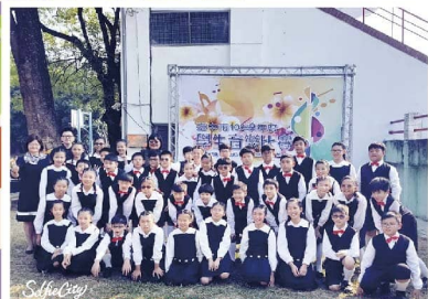
藝才班管樂合奏勇奪第一