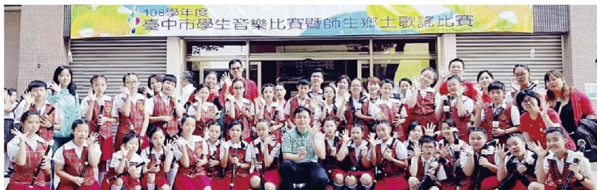
直笛團初試啼聲獲第三名