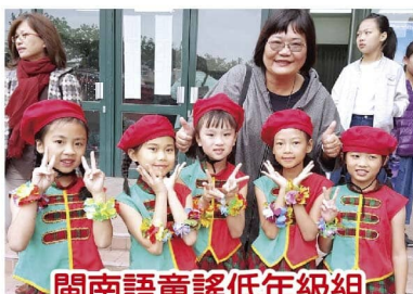
閩南語童謠低年級組第二名