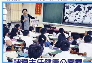
輔導主任健康公開課