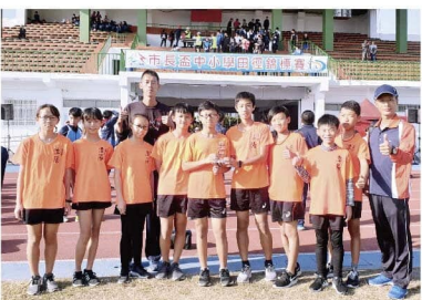
108年市長盃潭陽田徑好手