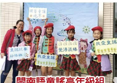
閩南語童謠高年級組第二名