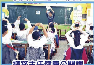
總務主任健康公開課