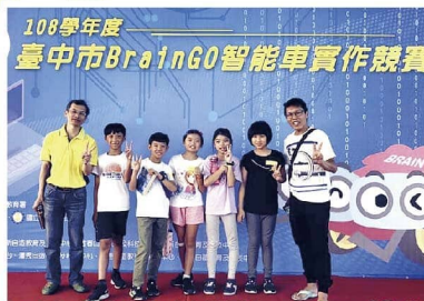
智能車競賽榮獲第三名及佳作