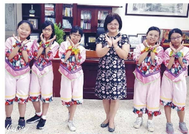
客家童謠高年級組第三名