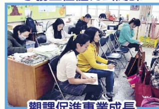
觀課促進專業成長